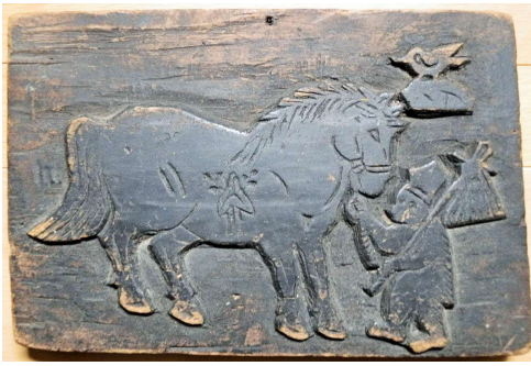
↑版木表の図柄 馬をひく猿 鳥(鶏?) 馬の腹に「オモダカ」