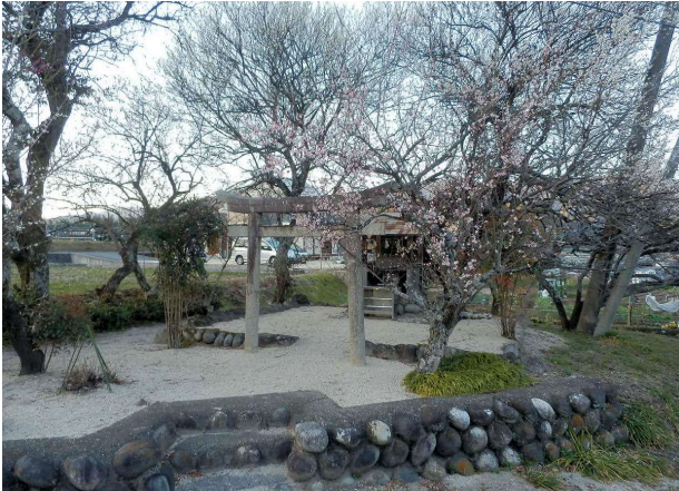
↑八重梅天満宮全景

中央線の大鉄橋脇の坂道を高部に向かうと高圧線の鉄塔があり、その前に梅の木に囲まれた小さな祠があります。